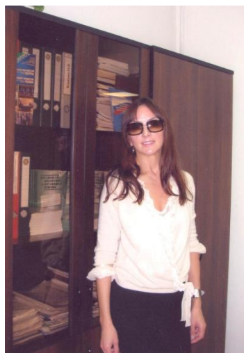
В рабочем кабинете