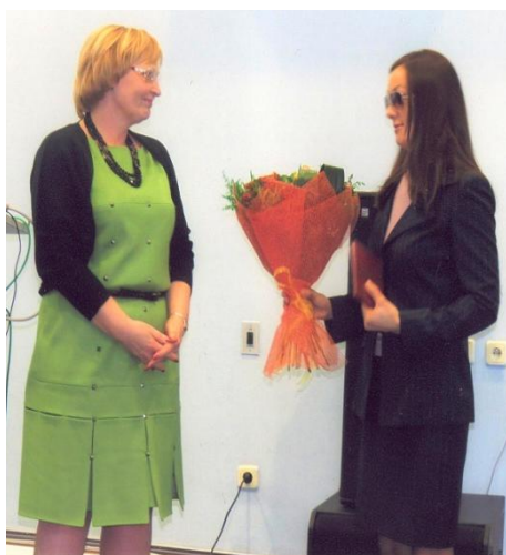
Поздравление с успешной защитой